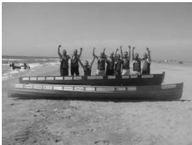
Soutaen halki Euroopan - voimalla yhdeksän miehen